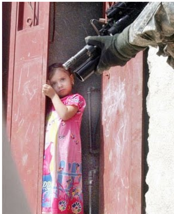
Sin voluntad política en derechos humanos

El gobierno de Felipe Calderón carece de voluntad política para superar los problemas estructurales que hacen posible la violación de los derechos humanos en el país, afirma Rupert Knox, investigador para México de Amnistía Internacional. En entrevista con Proceso, advierte: si no se deroga el fuero militar y se mantiene el uso político de la Procuraduría General de la República, México no podrá romper “el ciclo vicioso” de la injusticia, el cual reproduce cotidianamente los abusos de los “poderosos” y la impunidad de que disfrutan. Por lo pronto, desde el lunes 9 se encuentran en México los relatores especiales de la OEA, Catalina Botero, y de la ONU, Frank La Rue, invitados por el gobierno.