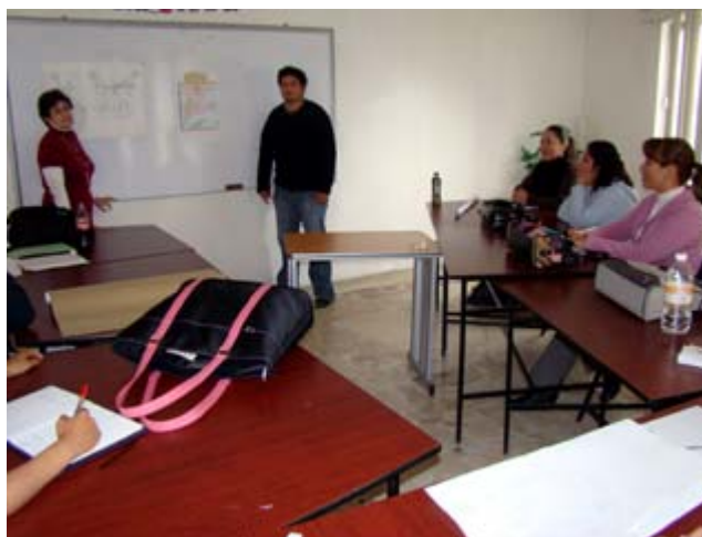
Aún hay muchos jóvenes sin poder estudiar.