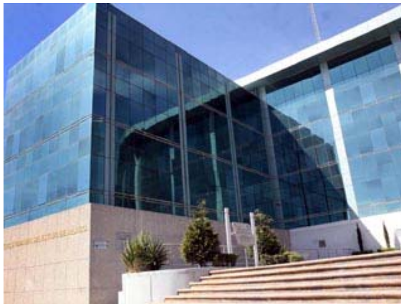
Se mantendrá atenta a casos particulares.

El comisionado de Derechos Humanos del Estado de México, Marco Antonio Morales Gómez aseguró que cualquier persona puede acceder a la adopción incluidos los matrimonios homosexuales.